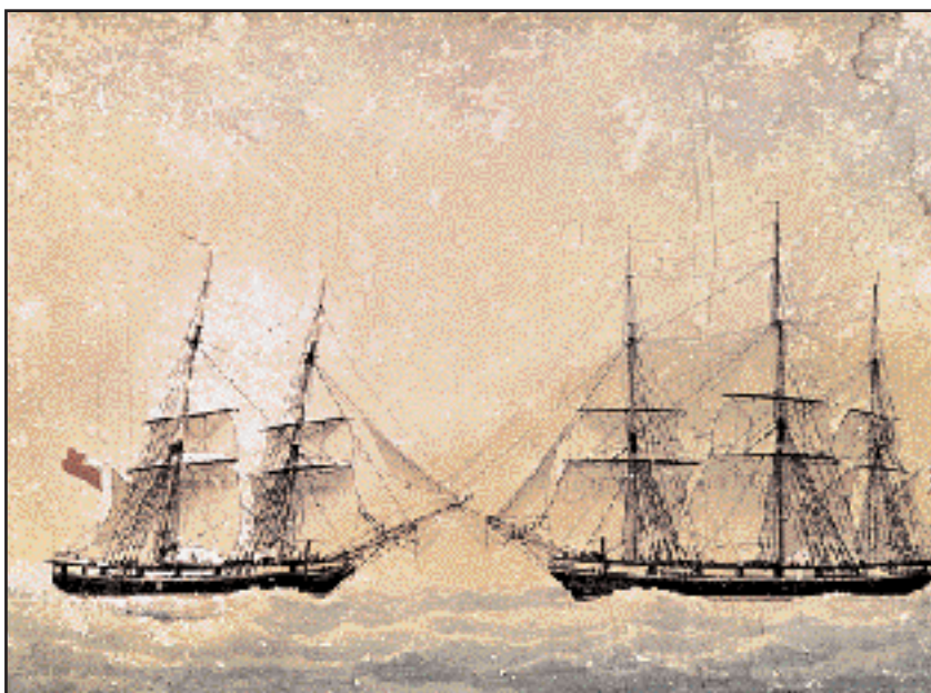
Η «Πλειάς» ή «Παλιά» και η πολάκα «Ποσειδών» του Παύλου Χατζηναργύρου. 1815. Εθνικό Ιστορικό Μουσείο.