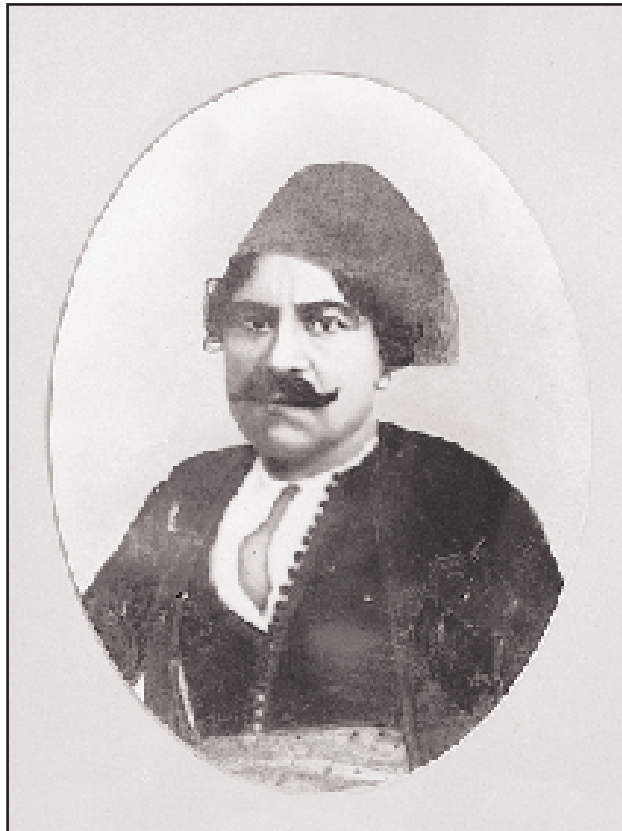
Ο Σπετσιώτης караβοκύρης και ναυμάχος Ιωάννης Γ. Κούτσας.

Ο Χατζηγιάννης Μέξης (αλλά και ο αδελφός του Θεοδωράκης) συμ-