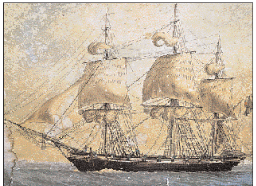
Η ναβέτα «Αχιλλεύς» των Μποτασαίων. Υδατογραφία του Αντουάν Ρου. Εθνικό Ιστορικό Μουσείο.