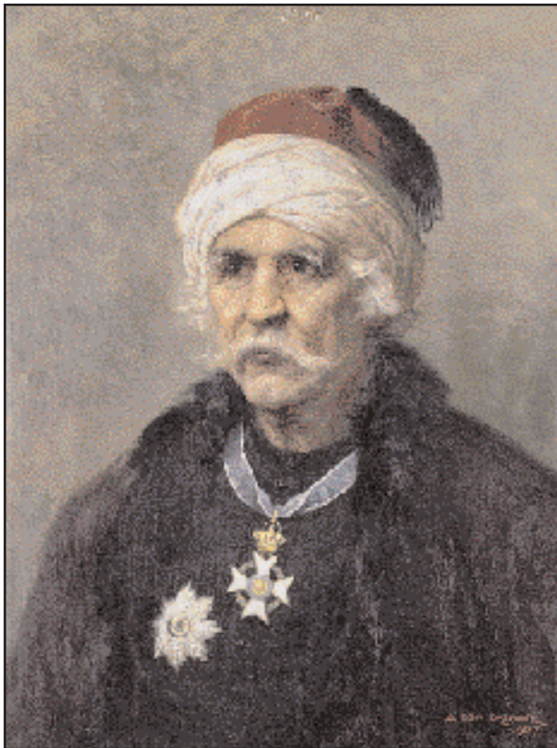
Ο Χατζηγιάννης Μέξης (1754–1844), πρόκριτος των Σπετσών, καραβοκύρης και πρωτομάχος στη νικηφόρα ναυμαχία των Σπετσών (Αρμάτα), τον Σεπτέμβριο του 1822. Εθνικό Ιστορικό Μουσείο.

Τα μεγάλα «θαλασσινά» σόγια των Σπετσών και η προσφορά τους