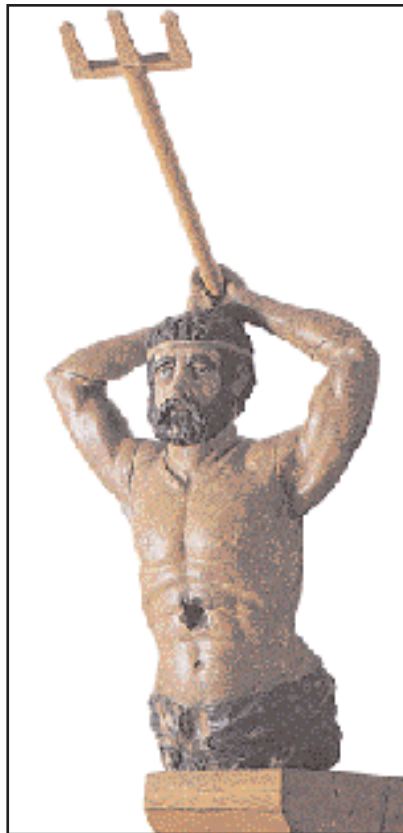
Το ακρόπρωρο –με τη μορφή του Ποσειδώνα– της θρυλικής πολάκας «Ποσειδών» του Παύλου Χατζηναργύρου. Μουσείο Σπετσών.