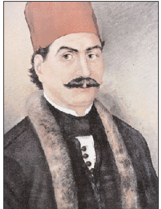
Ο Παναγιώτης Μπότασης (1784–1824), υστερότοκος γιος του Νικολάου Μπόταση. Διετέλεσε αντιπρόεδρος του Νομοτελεστικού Σώματος, αξίωμα στο οποίο τον διεδέχθη ο αδελφός του, Γκίκας, μετά τον ξαφνικό του θάνατο.