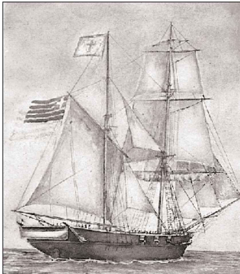
Η βρικογολέτα «Ασπασία» ή «Ερμαφρόδιτος» –ονομάστηκε έτσι επειδή δεν ήταν αμιγής τύπος σκάφους– ιδιοκτησίας των Κούτσηδων. Εμφανίστηκε στο αγωνιστικό προσκήνιο το 1826.

Μετά την απελευθέρωση οι Χατζηαναργυραίοι είχαν απολέσει, όπως όλοι σχεδόν οι Σπετσιώτες караβοκύρηδες, το μισό της ναυτικής τους δύναμης. Προσπάθησαν ωστόσο και κατάφεραν να ορθοποδίσουν ναυτεμπορικά, ύστερα μάλιστα από τη μικρή οικονομική ενίσχυση του Καποδίστρια και τις αποζημιώσεις των ετών 1853–1858, από το Υπουργείο των Οικονομικών. Ναυπήγησαν νέα καράβια, αλλά δεν άντεξαν στον ανταγωνισμό της ατμοπλοίας και καταποντίστηκαν εφοπλιστικά.