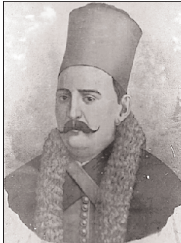
Ο Σπετσιώτης караβοκύρης και ναυμάχος Παύλος Χατζηναργύρου (φωτ. αρχείο Α.Κ.Σ.Σ.).

του Γεώργιου Κουντουριώτη, προέδρου της Εκτελεστικής Επιτροπής κατά την Επανάσταση.